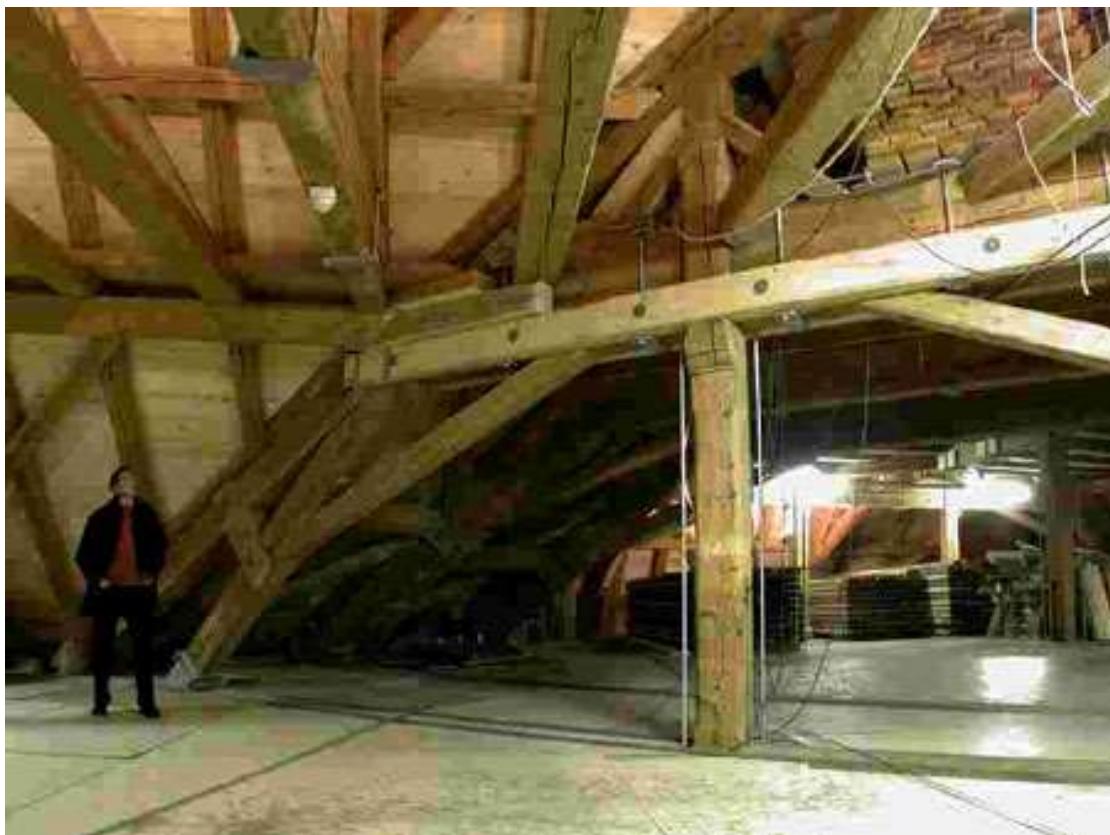
Projekt: Sanierung Kloster Einsiedeln