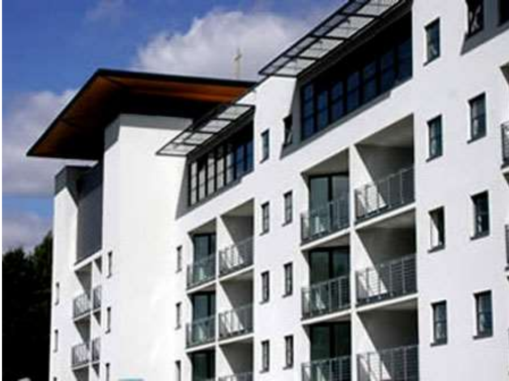
Projekt: Neubau Kirche und Erweiterung des bestehenden Familienzentrums